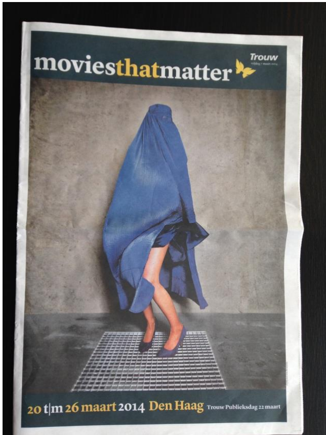
Marilyn-moslima-Monroe, TROUW Publieksdag 2014

De exercitie die wij als Stichting op ons hebben genomen is bedoeld als kader om systematisch, en vooral vrij van academische besognes en politieke belemmeringen, te kunnen reflecteren over een precair onderwerp dat velen van ons bezighoudt. We doen dat met alle beeldkennis waarover we vanuit onze respectievelijke vakgebieden beschikken. Namens alle (gast)auteurs van dit nummer wensen we u met onze bijdragen een grondig ver-maak toe.