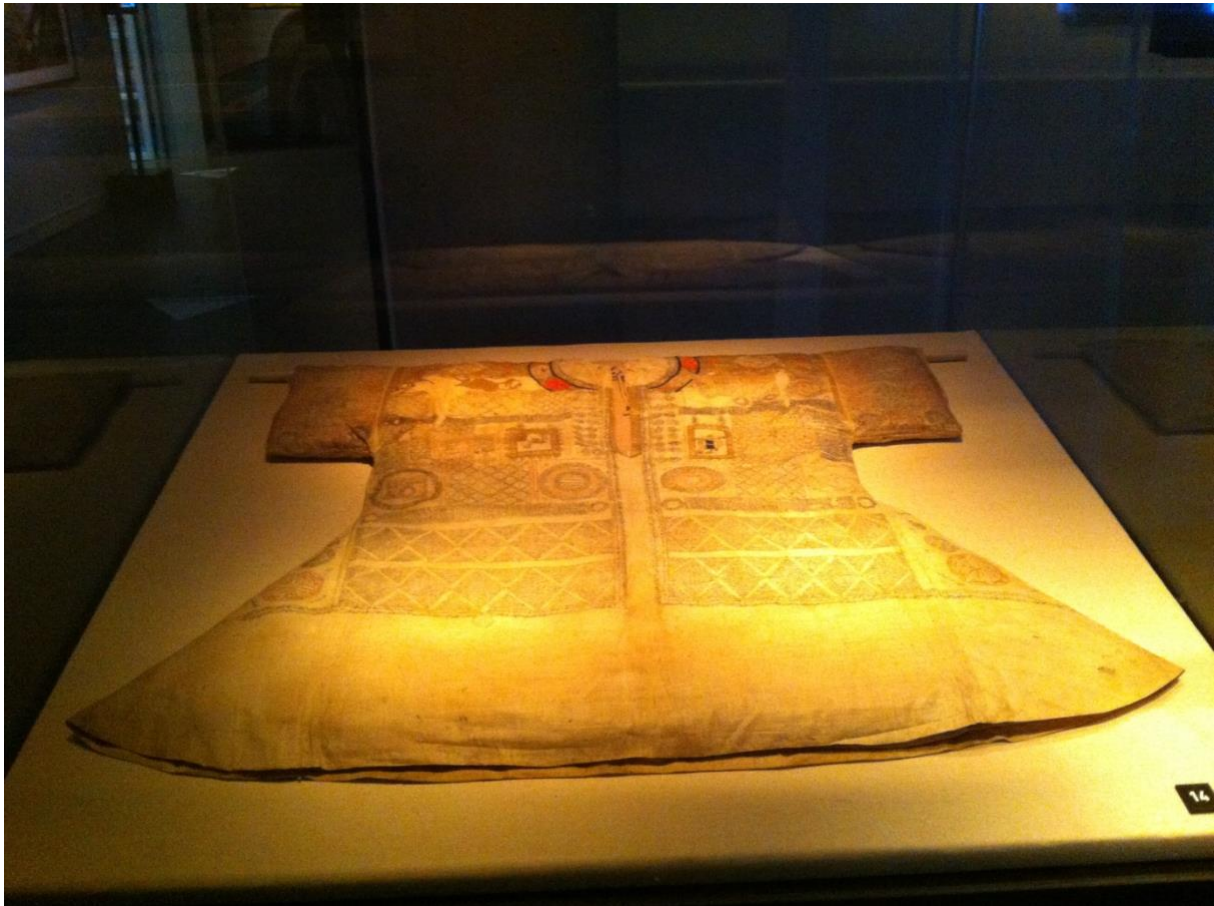
2. Magisch hemd met afbeelding van Mekka en Medina. 16e, begin 17e eeuw. Collection of Islamic Art, Londen, TXT 471. Zie Verlangen naar Mekka (2013, p. 117).