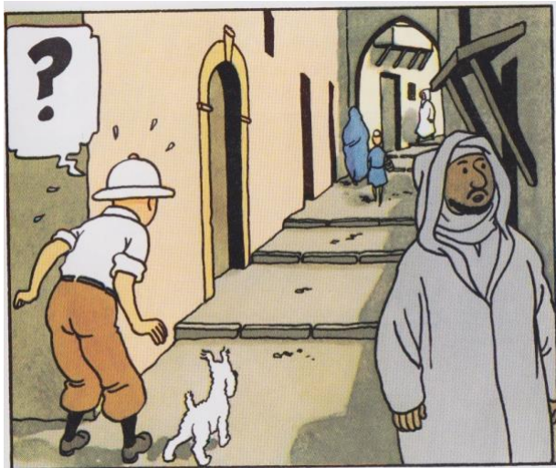
Uit: De krab met de gulden scharen , p. 41

Het was in die wereld dat ik – zoals gezegd – voor het eerst vrouwen in het oog kreeg die volledig waren bedekt. Ik licht het met enkele voorbeelden toe. Neem de straatscènes uit De krab met de gulden scharen waar zowel mannen als vrouwen in lange gewaden rondlopen (p. 39-41). Het is veelzeggend dat Jansen en Jansen, die als detectives maar al te goed weten hoe belangrijk het is om onherkenbaar te zijn, alvorens de straat op te gaan een boerenoos aantrekken (p. 45-48). Als Kuifje zich even later vermomt, neemt hij niet alleen een bril en een baard, maar hult ook hij zich in een blauwe kaftan (p. 50-53). Zo leer je als jongen dat er landen zijn waar iedereen in lange gewaden rondloopt.