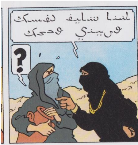
Uit: Cokes in voorraad , p. 25

hun gezicht en slagen er zelfs in met een waterkruik op hun hoofd te lopen. Maar dan komen ze bij een waterput waar een volledig in het zwart gehulde vrouw staat. Als zij de twee helden in het Arabisch aanspreekt weten deze natuurlijk niets terug te zeggen. Waarop de vrouw met een woedend gebaar de sluier van kapitein Haddock wegrukt en... oog in oog komt te staan met een baard! Als de kapitein dan ook nog een blaffende Bobby uit zijn waterkruik tevoorschijn tovert, rent de hevig geschrokken vrouw weg van de put in de richting van een ommuurde stad waar ook een minaret staat (p. 24-26). Het illustreert dat culturele botsingen al een halve eeuw geleden in beeld werden gebracht.