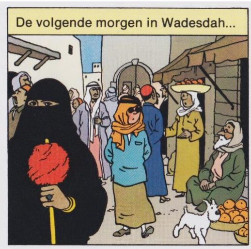
Uit: Kuifje en het zwarte goud , p. 40

Eenzelfde inzicht kon je opdoen aan Kuifje en het zwarte goud dat zich ergens in het Midden-Oosten afspeelt. Het fictieve karakter van dit verhaal verhindert niet dat je als jongen van tien het nodige over moslims opsteekt, bijvoorbeeld over het feit dat ze bidden met hun gezicht naar Mekka waardoor hun kont omhoog steekt (p. 22), wat er tijdens een zandstorm gebeurt (p. 30-33), hoe het Arabische schrift eruit ziet (p. 22, p. 37), wat de vorm is van een moskee (p. 34), hoe je de weg kwijt raakt in een woestijn (p. 29-30), welke kleding een emir aan heeft (p. 34-40) of hoe een Portugese handelaar zich ter plekke gedraagt (p. 40-43). Een van de tekeningen toont een heuse niqaab (p. 40, plaatje 9) waarbij opvalt hoe zorgvuldig de effecten in beeld zijn gemaakt. Van de betreffende vrouw zijn alleen de ogen te zien maar het is alsof ze ons direct aankijkt.